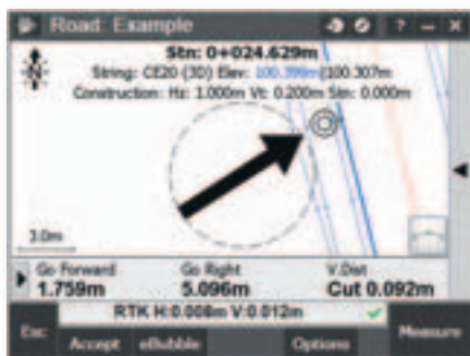
Implantation par station sur tronçon avec un déport de construction horizontal